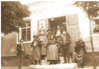
▲ Perbáli archív képek