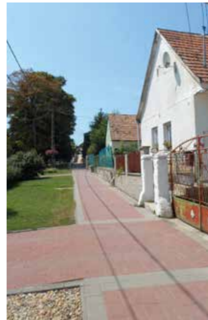
A posta előtti tér egykor és ma.