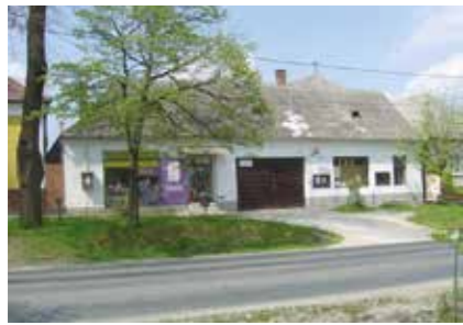
A közösségi ház egykor és ma. ▲▶ Építész: Urr Gábor

cég Perbálon, Paládi-Kovács Ádám tervezett nekik üzemi épületet, na, azon látszik, hogy építész tervezte, igényes munka.