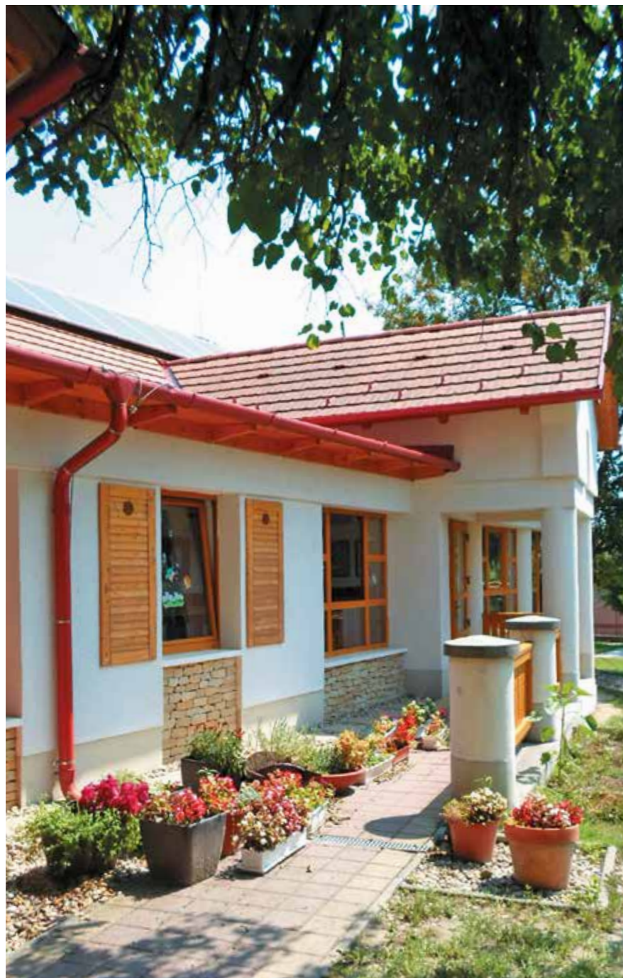
Mézeskalács óvoda. Építész: Urr Gábor ▲

Én úgy tudom, és tudtommal kormánydöntés is van róla, hogy ez az út meg fog épülni. Csak nem azon a nyomvonalon, ahová kezdetben tervezték. Ebben a kérdésben visszakanyarodnék a HÉSZ-hez, illetve a kiváráshoz. Ha az idők során minden előírt településfejlesztési dokumentumot (amikről az előbbiekben beszéltem) az eredeti határidőre, szorgalmasan megcsináltunk volna, akkor a HÉSZ-ünkben is szerepelt volna egy Perbált elkerülő út nyomvonala. Igen ám, de ez az út ma már nem ott megy, ahol tegnap még ment. Kezdhetnénk újra. Ha ez a kérdés végre fixálódik, na, akkor fogjuk megcsinálni a végleges Helyi Építési Szabályzatunkat. Hiszen ez nem csak egy vonal a térképen, erre hosszú távon egy település rászervez dolgokat.