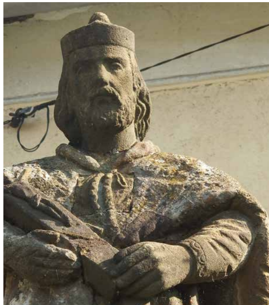
Szent Vendel-szobor ▲