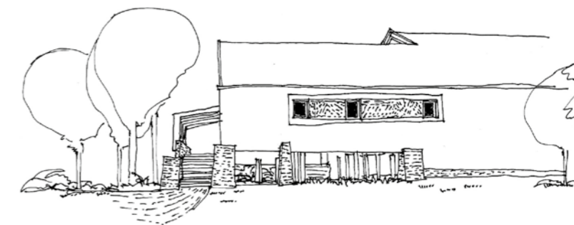
▲ Homlokzati vázlat

A mintaterv kidolgozása közben alakult ki a leendő helyszínek végleges sora, melyek ismerete segítette megtalálni azokat a beavatkozási pontokat, ahol a mintatervet rugalmassá, befogadóvá kellett tenni a lehető legjobb helyszíni illesztés érdekében. Az uszodák helyszíni adaptációját is a mintatervet kidolgozó építészcsapattal készítettük, ezért minden adaptáció úgy kaphatott egyéni hangnemet, hogy a tervezője minden részletében ismerte az alaptervet és annak lehetőségeit. A nagyon eltérő épített és társadalmi környezetbe telepített épületek adaptációja megmutatta a