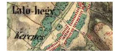
◀ ▶ Arhív térképrészletek, Kerepes

váltás. Agglomerációs probléma, hogy a lakosok nagyon nagy része nem helyben dolgozik. Reggel beül az autójába, és ezen az útvonalon bemegy valamilyen fővárosi kerületbe, és este sötétben hazamegy ugyanitt. Ahelyett, hogy ez a nyomvonal a helyben való időtöltés tere lenne, ma csupán arra szolgál, hogy az itt lakók minél hamarabb elhagyják a települést.