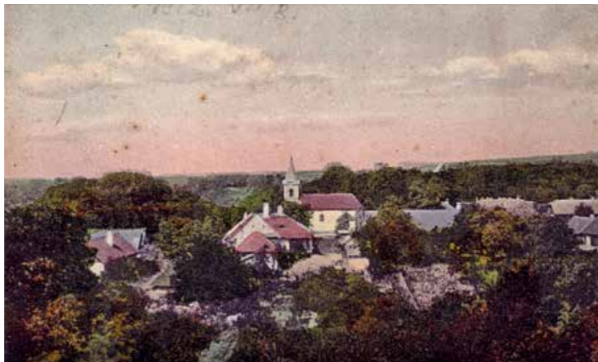
▼ Kerekes látképe arhív képeslapon