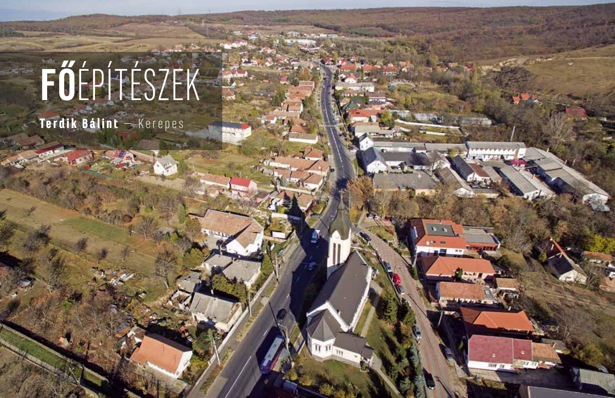
▲ Drónfelvétel, Kerepes