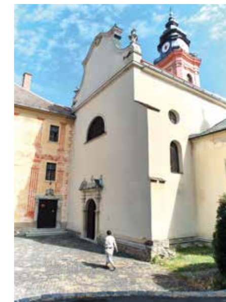
▲ A pálos-piarista templom

Többször voltam ösztöndíjjal Franciaországban. Ottani barátaimmal beszélgetve szóba került főépítési működésem. A szó megfelelő fordításán dilemmázva rá kellett jönnöm, hogy ez nem más, mint a polgármester főtanácsadója. Ha ezt szó szerint vesszük, és valaki ebben a formában tudja magát elfogadtatni, kapcsolatot kialakítani egy településsel, akkor meggyőződésem, hogy eredményes lesz, mert szerepe a helyén van. Ez persze kölcsönös kell hogy legyen. Sokszor nem biztos, hogy első körben érvényesíthető a szakmai ol-