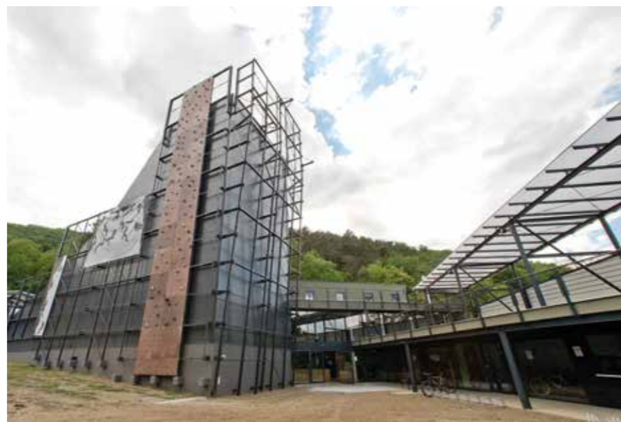
▲ Magas-hegyi Falmászóközpont. Építész: Radványi György, 2015

Fől kell tudni készíteni egy ilyen változásra a település összes lakóját, hogy ne egyfajta beletörődéssel fogadják a terveket, mert abban mindig ott vannak az ellenhangok, hanem érezzék úgy, hogy cselekvő részesei a folyamatnak. Ehhez megfelelő szakember kell, és erre a települések nagy része ma még nem készült fel. Éppen ezért a várható változásokat és ezek hatásait nem igazán tudják kézben tartani. Sátoraljaújhelyen mind a polgármester, mind az alpolgármester és titkársága nagyon aktív volt, a lakossági tájékoztatás jól működött. Ráadásul itt egy településszövetségről van szó, melyet Sátoraljaújhely, Széphalom, Károlyfalva és Rudabányácska alkotnak, sajátos, önálló világgal. Megtartani valamiféle önállóságot és jó szellemben kezelni az összetartozást: komoly feladat. A hovatartozás fontosságát jól példázza az utcatáblák helyi rendszere: a sátoraljaújhelyi címer mellett megjelenik az adott települési címer, az adott történelmi városrész neve, végül az utcanév.