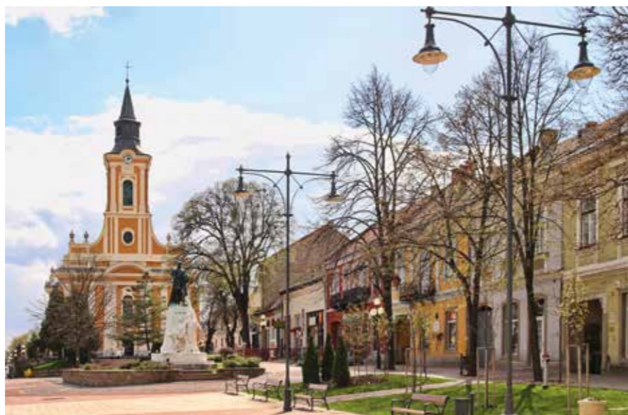
▲ A Kossuth tér a Nagytemplommal