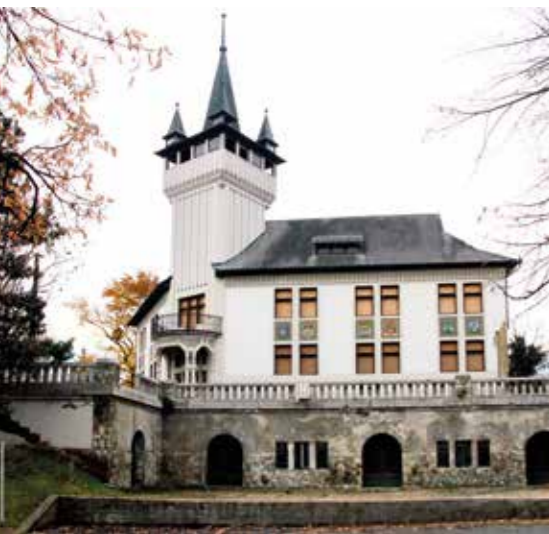
◀ Bortemplom, egykori Állami Közpince. Építész: Váczy-Hübschl Kálmán, 1913