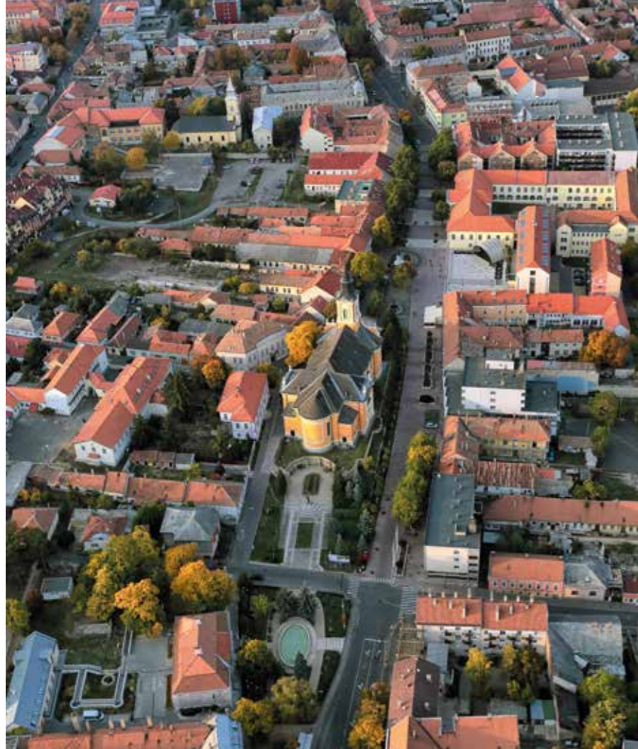
◀ Belváros a Nagytemplommal

Sátoraljaújhely polgármestere: vállalom el a főépítési tisztséget. Örömmel mondtam igent, azzal a feltétellel, hogy megvárjuk, amíg végigfut a széphalmi munka. Megbízottként vállaltam el a főépítési státuszt, eleinte heti egy, majd igény szerinti időbeosztással.