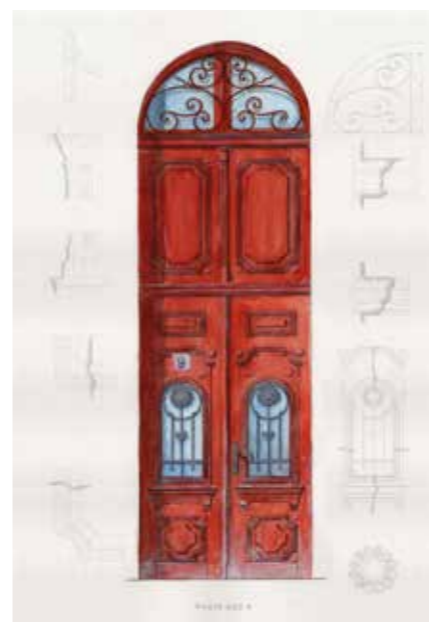
▶ Részletképzés és kompozíció – hallgatói felmérési rajzok

A borászat és a borkereskedés ma is jelentős szegmens. Valamikor Sátoraljaújhely a borforgalmazás északi központja volt. Egyik komoly létesítménye a jelenleg romos állapotú, de a közeljövőben helyreállítani kívánt Bor templom, azaz az egykori Állami Közpince. Az épület 1913-ban épült Váczy-Hübschl Kálmán tervei szerint; igaz, korábban sokáig Toroczkai Wigand Edének tulajdonították. A nagy filoxérajárványt követően, óriási állami beavatkozásként a helyreálló borforgalmazáshoz kötődő feladatokat volt hivatott összefogni. A közel háromezer négyzetméteres pince, a chateau-szerű kereskedelmi központ közvetlen iparivágány-csatlakozással rendelkezett, laborokkal, díszes árverési teremmel. Az intézmény a történelem vihariban elhalt ugyan, de mint háttér, ma is fontos továbbélési lehetőség, melynek fellesztésén dolgoznak tulajdonosai: a történelmi emlékek és értékek iránt elkötelezett, az együttes megmentéséért fellépő tulajdonos és az időközben örvedetesen tulajdonba lépett önkormányzat. Az ipari park gyártócsarnokaiban működő cégek a környék jelentős munkaadói. Mindemellett igen komoly középiskolai élet zajlik itt többnyelvű és szakirányú képzéssel,