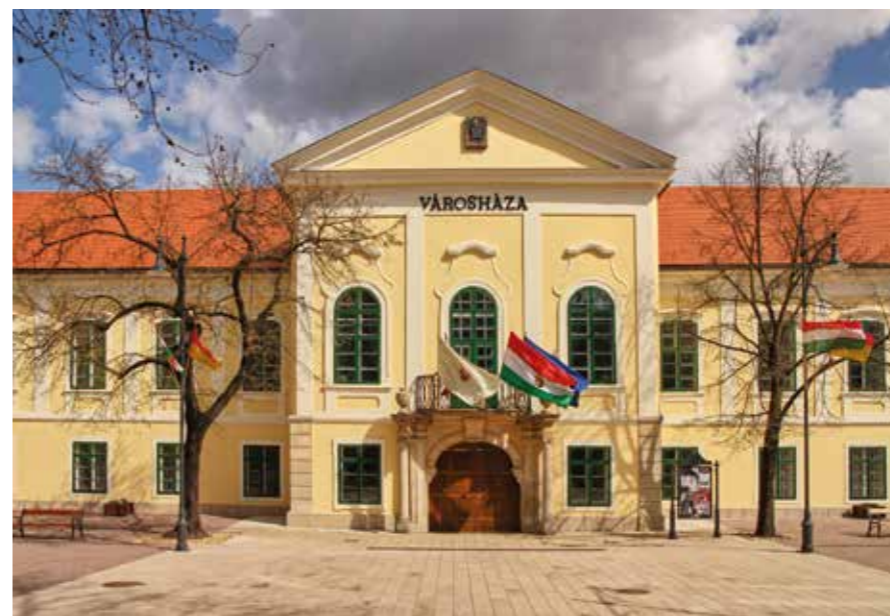
◀ A Városháza

szé meghaladó elmélyedésre volt szükség, hogy az érintett rendeleti körökbe megfelelő szinten beléssak, és így rövid, érdemi hozzászólásokra és elfogadható időn belüli korrekciókra nyíljon lehetőségem. Akkor még rugalmasabb kezelésre volt lehetőség a településrendezés terén, ma már akár fél évet is igénybe vehet egy ilyen procedúra, ha egyáltalán lehetőség adódik a javításra.