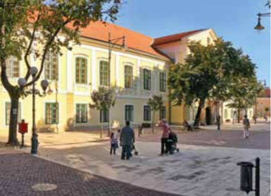
◀ A Kossuth tér a Városházával

egy területet, ahol ez konfliktusmentesen megvalósítható. Ráadásul a tulajdonosi viszonyok többször változnak. Szerencsés, ha a szabályozások előrelátóak, és a megkívánt és a megengedett között megtalálják az egyensúlyt. Sátoraljaújhely fontos közigazgatási és kereskedelmi központ volt, ennek köszönhetően vívta ki előkelő státuszát a múlt század elejére. A városvezetés jól látta, hogy az egyensúly érdekében megengedhetetlen, hogy a belső területek szétrobbanjanak a nagy felületű kereskedőlétesítmények miatt. A jelenlegi területen is megtalálták számításait a kereskedők, csakúgy, mint a belső területek kis üzletei – ez pedig mindent igazol.