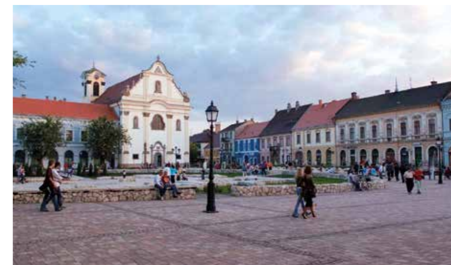
▲ Váci főtér

Mit csinál egy főépítész? Először azt tartották fő feladatnak – a településrendezés mellett –, hogy az új épületek terveibe szóljon bele. Majd következett az örökségvédelem, végül a feladat kiegészült a fejlesztéssel.