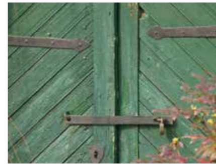
Sétálóutca, Esztergom