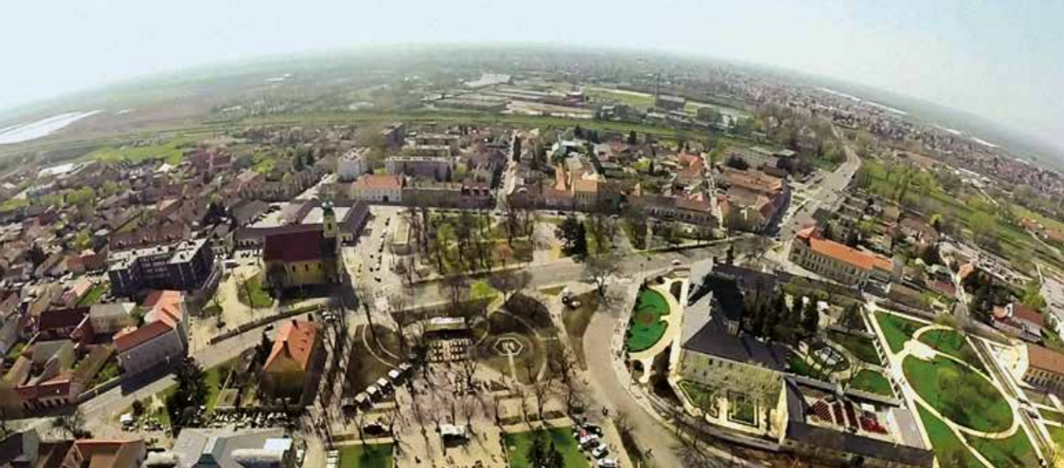
▲ Légi felvétel Hatvan belvárosáról

odacsábítottam, akivel korábban 15 évig együtt dolgoztunk. Mert a főépítész álmodik, valakinek azonban kiválóan meg is kell valósítania az elképzeléseit.