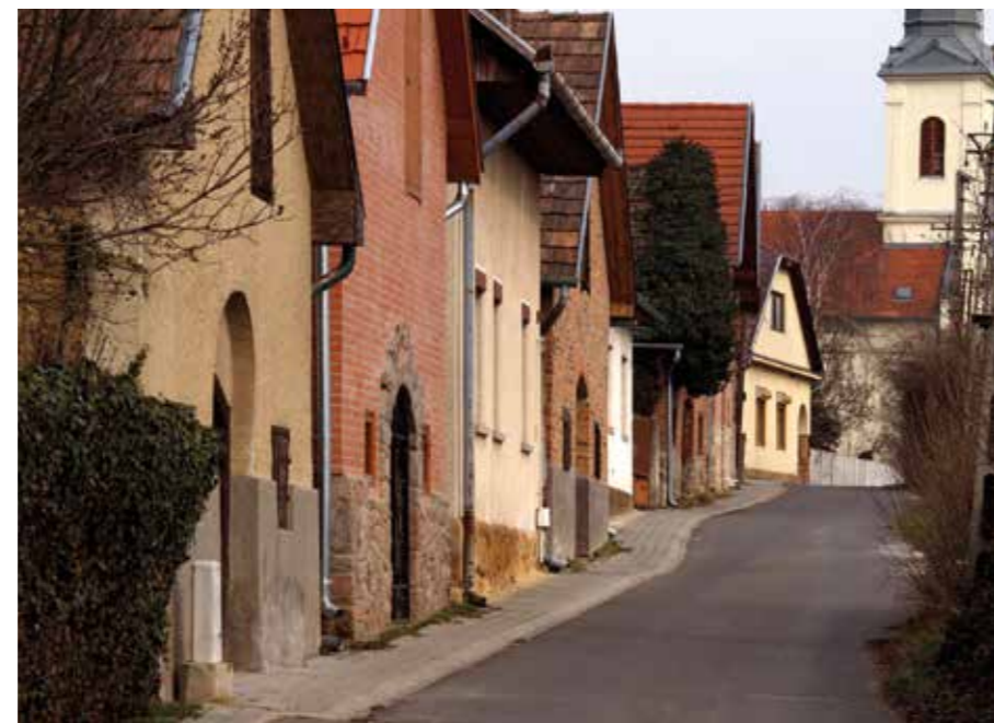
▲ Kismarosi pincesor.

Ha Vác hárompontos nehézségű, akkor Esztergom tízet ér el ezen a skálán. Itt közelebb van az ég a földhöz, az ország szakrális központja, egykori fővárosa, ahol kissé megállt az idő. Rendkívüli szakmai kihívás. Elsősorban karaktert kell adni a városnak. A testületnek tett ígéretemben vállaltam, hogy ez év végére kijelöljük azokat az irányokat, amelyekre a település alapozni tudja a jövőjét. Hála Istennek, és Romanek Etelka pol-