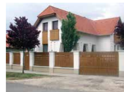
▲ Családi ház, Törökszentmiklós, 2010

Amikor a felvezetődben a kisvárosi lépték vonzalmáról kérdeztél, említettem, hogy ez így soha nem fogalmazódott meg bennem. Ugyanakkor azzal a döntéssel, hogy Törökszentmiklóst választottam lakóhelyemül, és ide kötöttem a munkavégzésem helyét is, léptéket tekintve meghatároztam – főképp utólag nézve – az építési lételemet. Törökszentmiklós kisváros. Amikor az önálló pályámat kezdtem, én lettem a városban a hatodik építész, és ez a szám azóta csak csökkent. Utánam senki nem jött vissza, pedig az évek során több fiatal is végzett építészként. Érdekes még, hogy mindenki egyedül dolgozott, ez pedig valahol meghatározza a tervezendő épület léptékét. Bár kezdetben próbáltam kísérletet tenni arra, hogy az egyik kollégámmal összefogjunk, ez nem járt sikerrel. Amikor