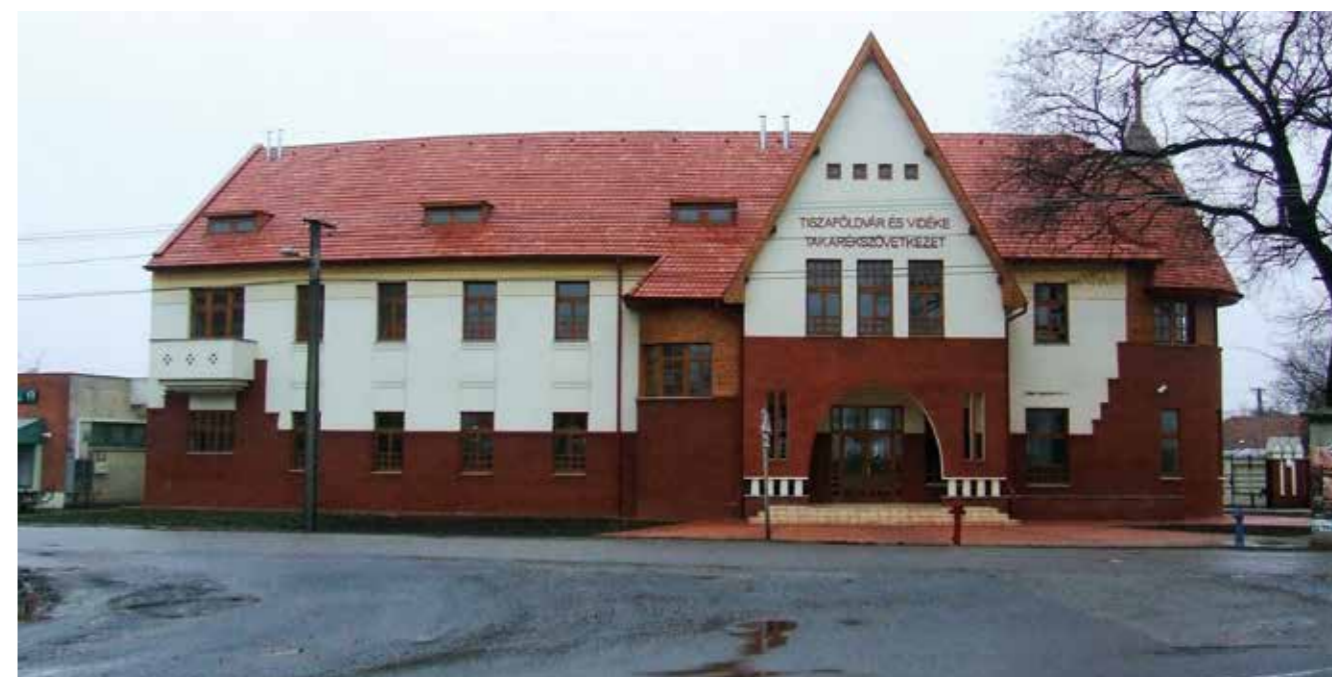
▲ Tiszaföldvár és Vidéke Takarékszövetkezet, Tiszaföldvár, 2008