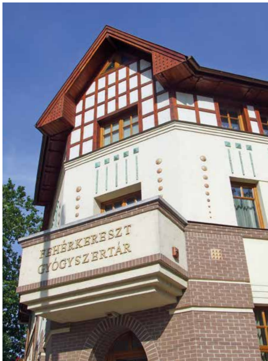
Társasház, Törökszentmiklós, 2008 ▼▶

ahol éled az életedet. De hogy a léptekre kicsit visszatérjek, így, kb. huszonöt év távlatából visszatekintve és értékelve a múltat, az én esetemben úgy látom, hogy valóban más volt a lépték itt, mint ha fiatalon Budapesten maradtam volna.