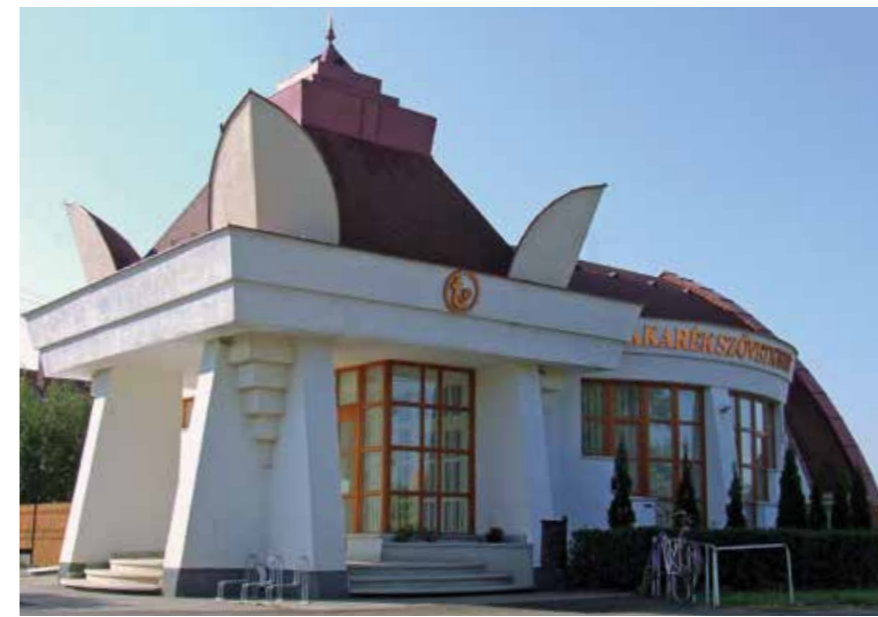
◀ Takarékszövetkezet, Tiszavárkony, 2002