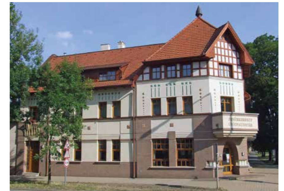
▲ Társasház, Törökszentmiklós, 2008