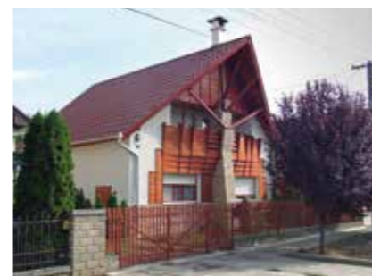
▲ Családirház-átalakítás, Törökszentmiklós, 2006

ben lebontott utcasorokról, épületekről. Azzal szembesültem, hogy már sok eltűnt közülük. Elindultam egy úton. Próbáltam beépítési tervek készíttetni meghatározó területekre. Létrehoztam egy rendeletet a helyi épített örökségünk védelméről. Az önkormányzat pályázatból felújított egy szecessziós polgári házat. Elindítottam az új települési rendezési terv előkészítését. De nem találtam a közös hangot az akkori polgármesterrel, így a 2002-es önkormányzati választások után, mivel ismét bizalmat kapott a választóktól, felmondtam a főépítési megbízást. Közel öt év szünet után, 2007 elején kért fel ismét főépítésznek az akkor új polgármester, és egészen 2014 nyaráig végezhettem szülővárosomban ezt a munkát. Ez a második ciklus már egészen másról szólt, mint az első két év. Bár ebben az időszakban is megtapasztaltam, hogy a politikai akarat nem hagyatkozik feltétlenül az építészeti érvekre, de türelmesebb voltam, mint korábban. Ekkor lehetőséget kaptam Tervtanács működtetésére is. Később azonban a képviselő-testülettel nem kaptunk forrást a működéshez, így a Tervtanács feloszlott. Erre az időszakra esett az Európai Unió 2007–2014-es fejlesztési ciklusa. Sikertelenül olyan pályázatokat megnyerni és a