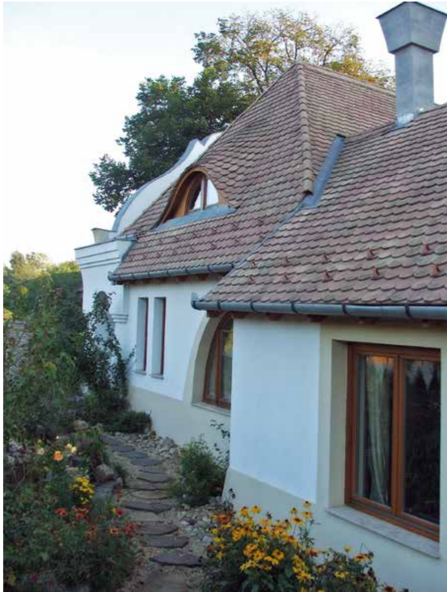
▼ Családi ház, Csömör, 2002