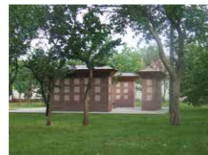
▲ Urnafal, Tiszapüspöki, 2012