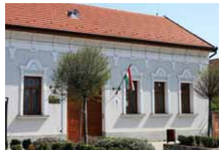
▲ Okmányiroda, Ócsa – Az egykori posta épülete a felújítást követően új funkciót kapott