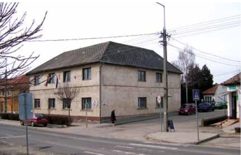
▼ Energetikai pályázat másképp: a Városháza jelenlegi és tervezett állapota