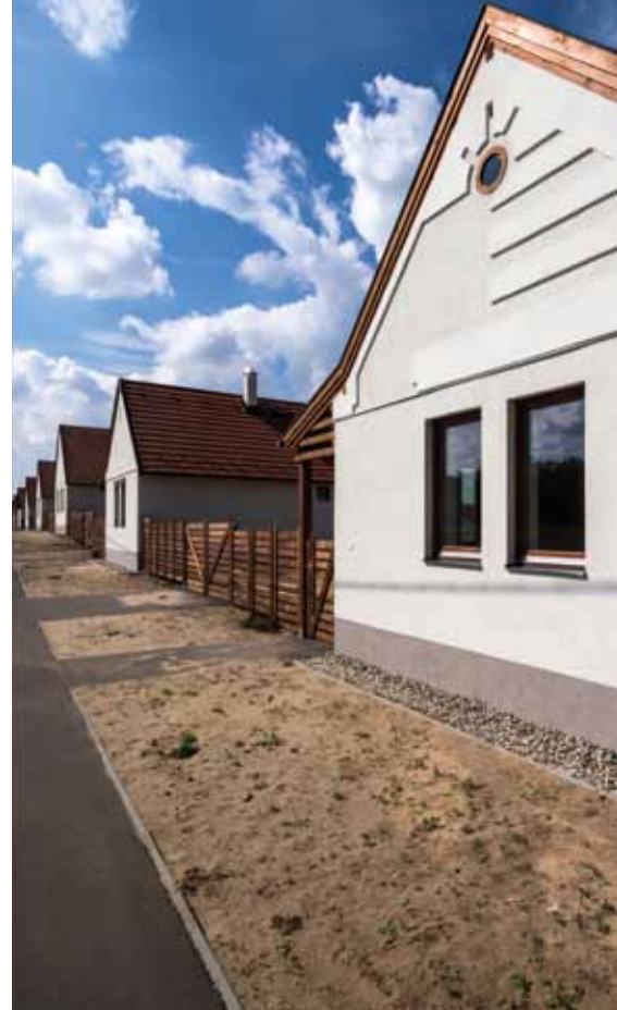
▲ Szociális lakópark, Ócsa

működik az Integrált Városfejlesztési Stratégia tekintetében. Miért is kapnának fejlesztési forrásokat olyan önkormányzatok, amelyeknek nincs elképzelésük a jövőről, és szakember bevonása nélkül kívánják felhasználni a támogatásokat? Másrészt azt is fontos lépésnek tartanám, ha a központi költségvetés részben vagy teljes egészében átvállalná az önkormányzatoktól a főépítészek foglalkoztatásának költségét, hasonlóan más, az önkormányzatok munkáját segítő szakemberekhez. Mindemellett nekünk is változnunk kell: tennivalóink vannak a képzés területén, vagy éppen a minőségi működés folyamatos ellenőrzésében. Jó alapnak tartom ehhez az Országos Főépítési Kollégium jogutódjaként nemrégiben megalakult Magyar Főépítészek Egyesületét. Ennek a szervezetnek fontos szerepet szánnék annak megítélésében, hogy ki láthat el ma főépítési feladatokat. Nekünk pedig, aktív főépítészeknek nagyon sok pozitív példát kell felmutatnunk. Itt nemcsak épületekre, fejlődő városokra gondolok, hanem haladóbb gondolkodású, igazi városvezetők bemutatására is. Ezzel egyrészt tovább segítenénk a munkájukat, közös munkánkat, másrészt mintát nyújtanánk az óvatos és szerényebb képességű településvezetőknek, polgármestereknek.