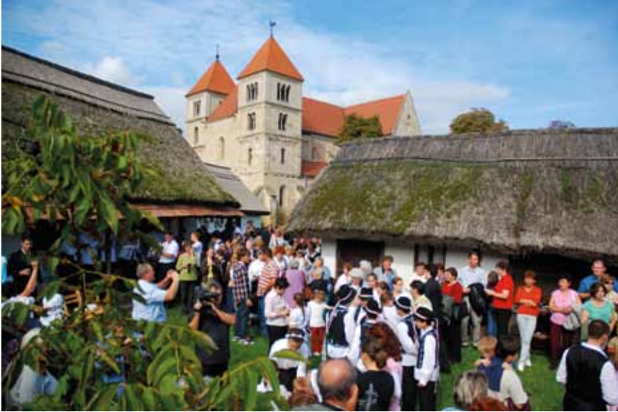
▼ Hagyományőrző rendezvény a tájházban

Az ország egyik legnépesebb, iparosodott területén az erőteljes emberi beavatkozások nehezen kiszámítható sodrásban maradt meg a Duna–Tisza közén hajdan kiterjedt lápterület egyik utolsó, ékes maradványfoltja. Az Ócsai Tájvédelmi Körzet botanikai és állattani ritkaságait, értékeit a 19. századi lecsapolások eredménytelensége miatt fennmaradt állandó vízjárásnak köszönheti. Területének egészére jellemző a mozaikosság, vagyis a nyílt vizek, nádasok, rétek, erdők, sztyepprétek váltakozása, és az ennek megfelelően váltakozó emberi tevékenységek nyomai. A kivételes természeti területet méltó módon egészíti ki a premontrei erődtemplom mellett megbúvó „öregfalú”, ahol még fellelhetők a 18. századi népi építészet nyomai, az ún. két beltelkes településszerkezet apró parasztportái, nádfedeles lakóépületei.