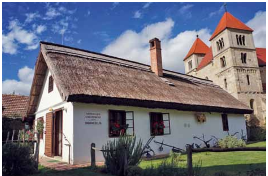
▲ Ócsai Tájház

Magasabb térszínen találkozunk a képerjés kiszáradó láprét társulással,