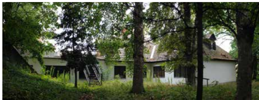
▲ ► Arkt Művészeti Ellátó, Eger