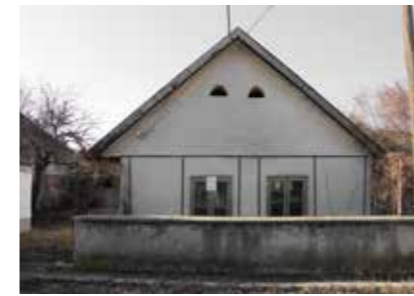
◀ Utcai homlokzat az átépítés előtt

Építész: Fajcsák Dénes , Fábián Gábor Szöveg: Csóka Balázs