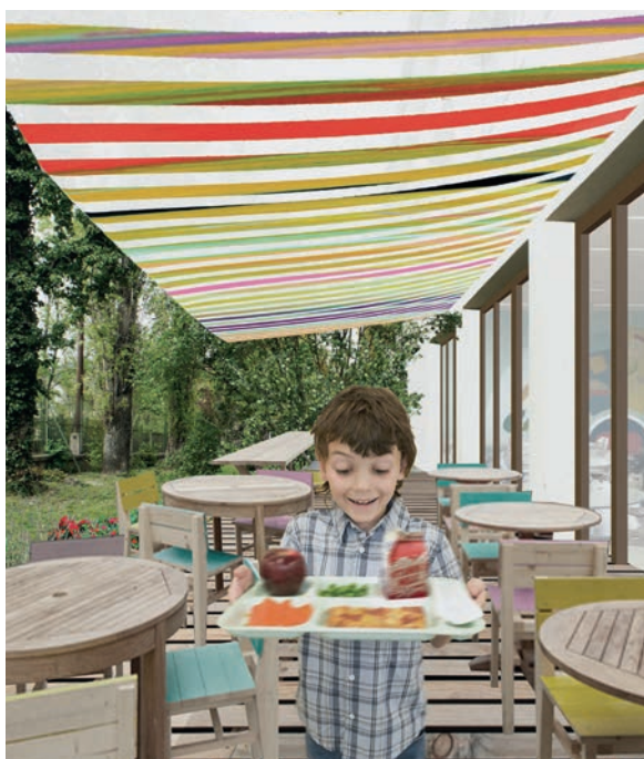
Menza Program, a BME Építőművészeti Iskola munkája

Kihívást jelent az építészeti minőséget és esztétikai megközelítést bevonni a döntéshozatalba. Fontosnak tartom, hogy a döntéshozónak ne csak azt kelljen mérlegelnie, hogy mennyibe kerül a beruházás és milyen jogi akadályokkal kell még megbirkóznia a megvalósítás érdekében, hanem azt is, hogy milyen kreatív potenciál tud megjelenni a beruházásban. Mert az építészeti minőség legalább akkora pillér, mint az előző kettő. Mindehhez nélkülözhetetlen, hogy a főépítész és a polgármester szerves munkakapcsolatban legyen egymással. Nálunk ez ideálisan működik, szívesen dolgozunk együtt. Polgármester úr kifejezetten fogékony a minőségi építészet iránt, fontosnak tartja, hogy magas minőségben valósuljanak meg a kerületi beruházások.