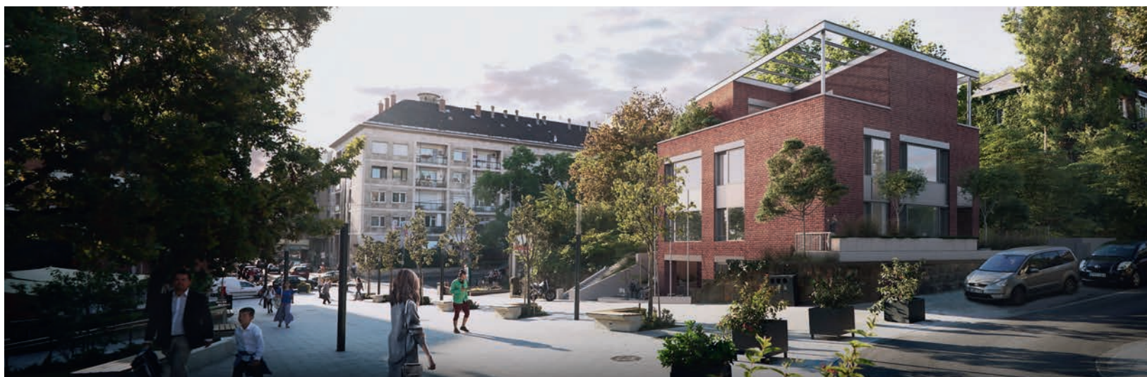
Kulturális Szalon, építész: Lenzsér Péter DLA

kozóan a BKK komplex tervet készítettett. A terv kezdetben csak a közterületi telekhatárig javasolt beavatkozást. A kerület vetette fel, hogy a terület identitása tovább erősödne azzal, ha a modern polgári főutca teljes keresztmetszetében és magas minőségben megújulna.