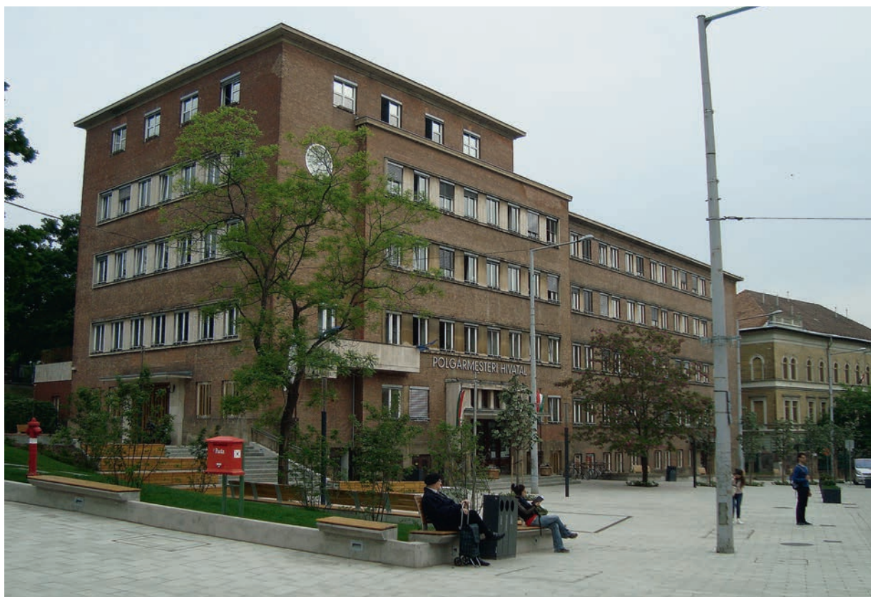
Városháza tér most és régen. Tervező: Platinum Group