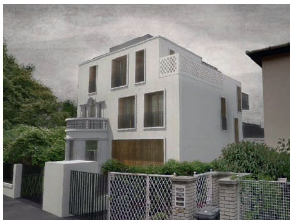
Családi ház átalakítása, Mihály utca Építész: Golda János, Kovács Zoltán; Kollektív Műterem

A kerület lakosai igazi lokálpatrióták. Nagyon büszkék arra, hogy ők I. kerületiek. Például amikor tavaly új településfejlesztési koncepciót és integrált településfejlesztési stratégiát kellett készítenünk, akkor meghívtuk a kerületben regisztrált társadalmi szervezeteket, és nem volt elég nagy a tárgyalónk. Van véleménye a lakosságnak és szeretik elmondani, amit gondolnak, de ez többnyire nem egyedi épületek kapcsán nyilvánul meg, hanem nagyobb projekteknél, főként azoknál, amelyek őket érintik.