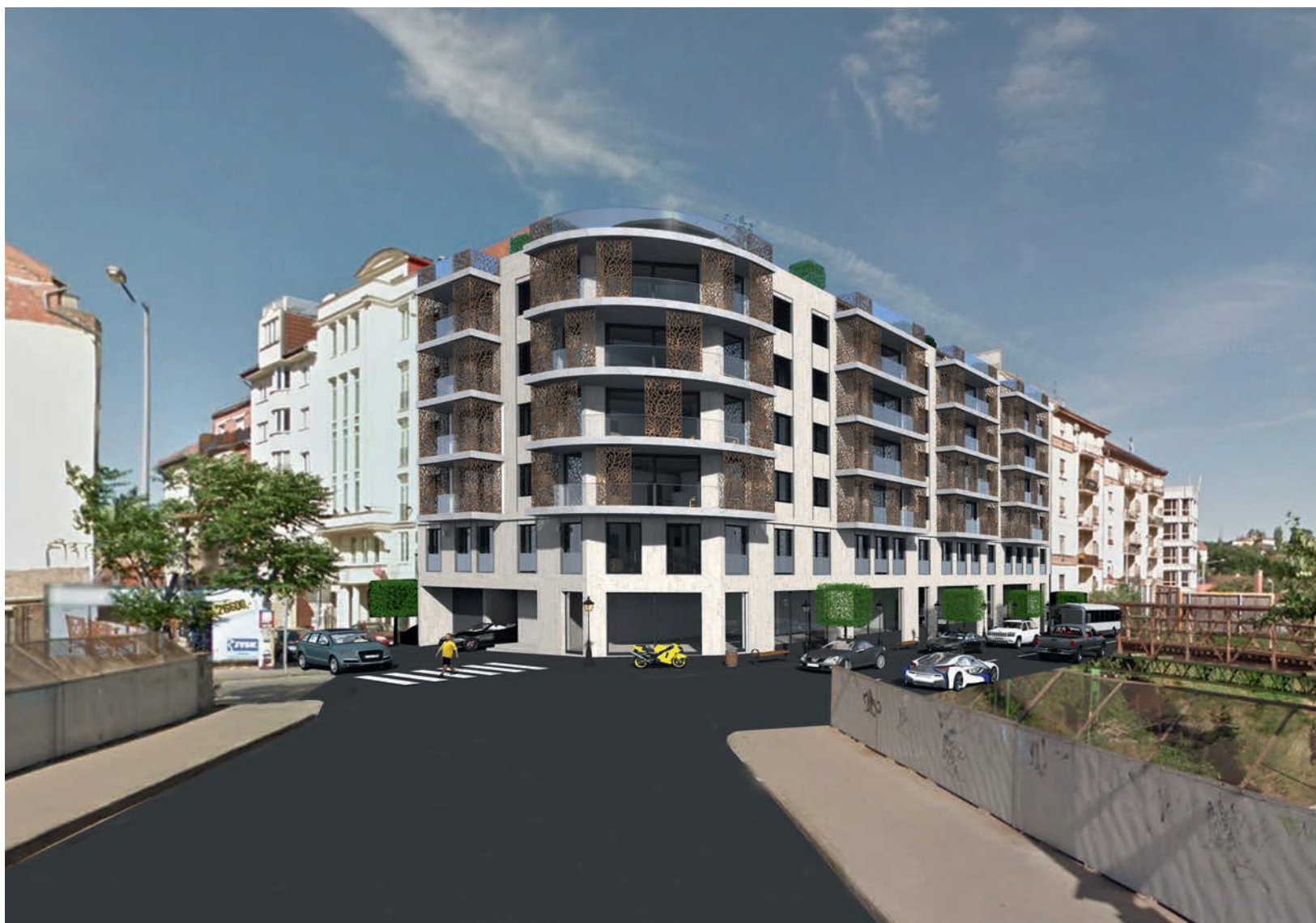
Társasház, Márvány utca Építész: Fézler Zsolt; Fézler Stúdió Kft.

jon megépülni, amilyen célból az ingatlant eladtuk, és olyan építészeti minőség tudjon benne megnyilvánulni, amit elvárunk. Az önkormányzat egésze együtt dolgozik. Például egy közterület-használati engedély kapcsán is kérdez a kollega, ha az önmagában nem is lenne településképi bejelentés-köteles.