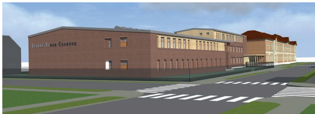
A Kada utcai általános iskola mellett megépült kosárlabda csarnok látványterve, Tervező: Kövér István, AAA Invest Kft.

Kerületünkben száz évvel ezelőtti, vagy még régebbi épületegyüttesek vannak, ilyen például az Északi Járműjavító Eiffel csarnoka, amelyet Feketeházy Ernő tervezett. Őt évvel ezelőtt, amikor egy döntés alapján