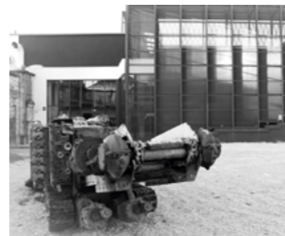
▼ Reimann Bányászattörténeti Miniverzum