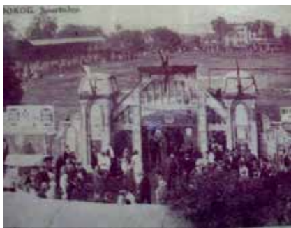
▲ ► A 100 éves kapu anno és ma