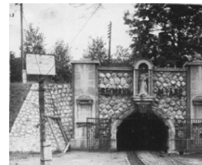
◀ Reimann Bányászattörténeti Miniverzum