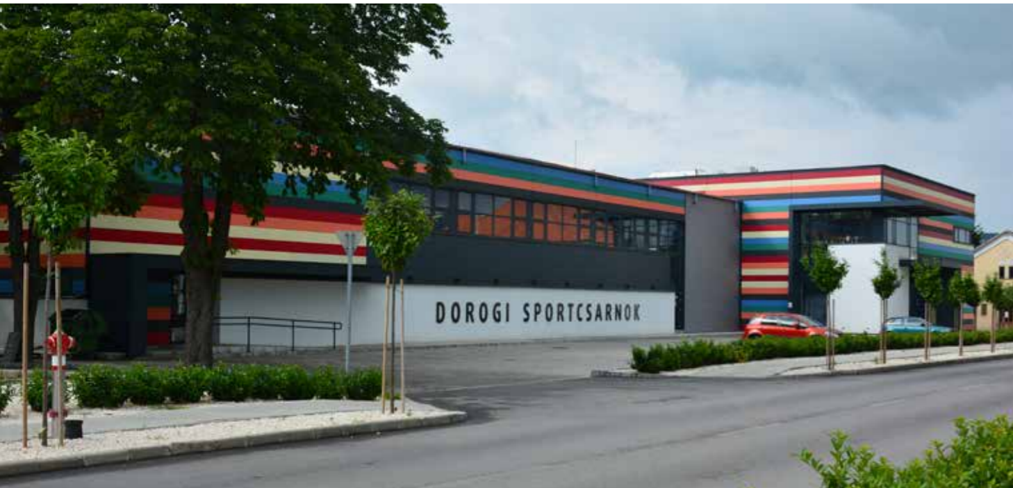
▲ Városi sportcsarnok

unk zászlóshajójának. A régi épületek – számos pályázatnak, önkormányzati önrésznek köszönhetően – megszépültek, új funkciót kapva a 21. századi város feladatainak adtak helyet és teret. Jó példa erre a volt bányakaszinó, amely jelenleg a Gáthy Zoltán Városi Könyvtárunk otthona, és a volt bányanagyiroda, amely napjainkban az Intézmények Háza. Ott székel számos egyesület, cég az okmányiroda, a kormányhivatal berkein belül. A dorogiai identitását két erős pillér adja: a sváb és a bányászati hagyományok. Mindkettőt ápoljuk, videó- és fotótárunk, számos kiadvány, helytörténeti kutatóink viszik tovább örökségünket, teszik színessé mai létünket, határozzák meg, milyen doroginak lenni. Három évvel ezelőtt megújult Német Nemze-