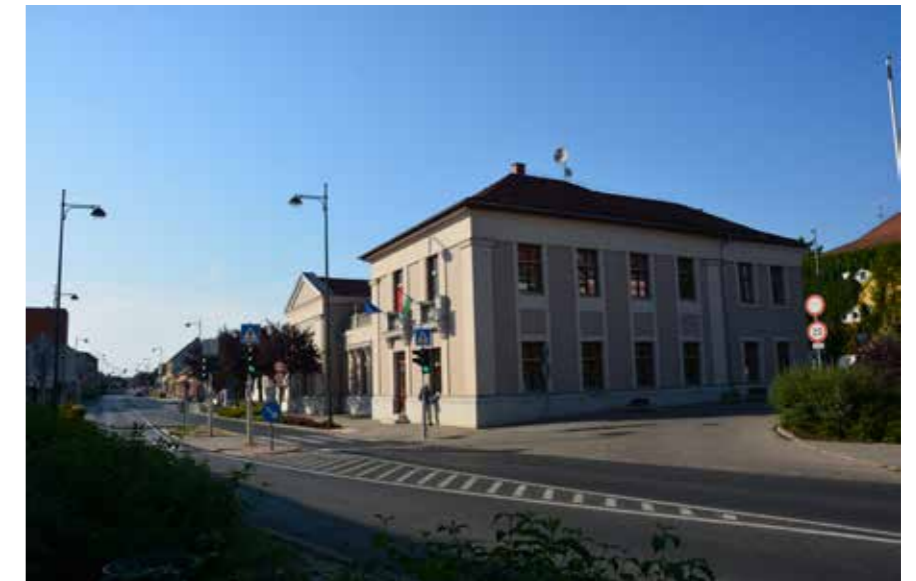
▼ Városi könyvtár és helytörténeti múzeum

Nem feltétlenül az engedélyköteles tevékenységeknél jönnek elő a problémák, hanem az utcaképet romboló homlokzati átalakításoknál: homlokzatszínezéseknél, a klímák elhelyezésénél, a zavaró reklámfeliratok kihelyezésénél. Az épületeknél az engedélyköteles eljárásoknál tudunk hatni arra – jogilag, esetleg meggyőzéssel, ráhatással –, hogy jó, jobb legyen az épület, míg sajnos a házilag megoldásoknál néha csak a kész munka végén szembesülünk a bántó küllemmel. Erre kitaláltunk egy közös pályázatot a városban működő vako-lyártó céggel, a Baumit Kft.-vel. Így – az önkormányzat anyagi támogatásával és a vállalat termékeivel – hatni tudunk az építészeti minőségre. Ennek köszönhetően az utcaképek megfelelő minőségben tudnak megújulni.