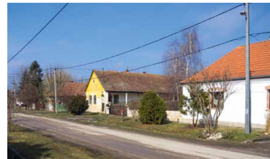
▲ Fő utca