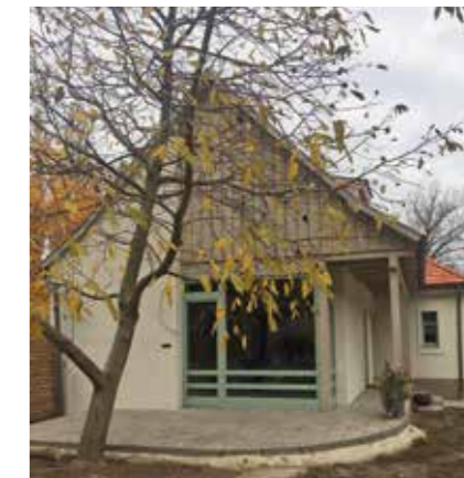
▲ Kockaház átalakítása. Építész: Csóka Balázs

hosszú távon a légrétegek eltüntetésével, föld alá vitelével. Így érhető el, hogy az egykori főutca visszakapja régi méltóságát.