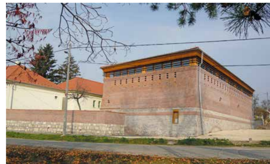
▲ Tornacsarnok. Építész: Kuli László

mot tartani, de valljuk be, ez nem mozgat meg nagy tömegeket, hisz olyasmiről kellene beszélni, ami még nincs. A második ilyen fórumot a kézikönyv munkaközi verziójának bemutatása után tartottuk. Az iránt már nagyobb volt az érdeklődés, hiszen volt mihez hozzászólni. A legtöbben egyébként azt kérték, hogy a település minél több területén erősítsük az ófaluban meglévő építészeti minőséget és hangulatot! Fontos ez a visszacsatolás, hiszen a főépítész elsősorban a közösségért tevékenykedik.